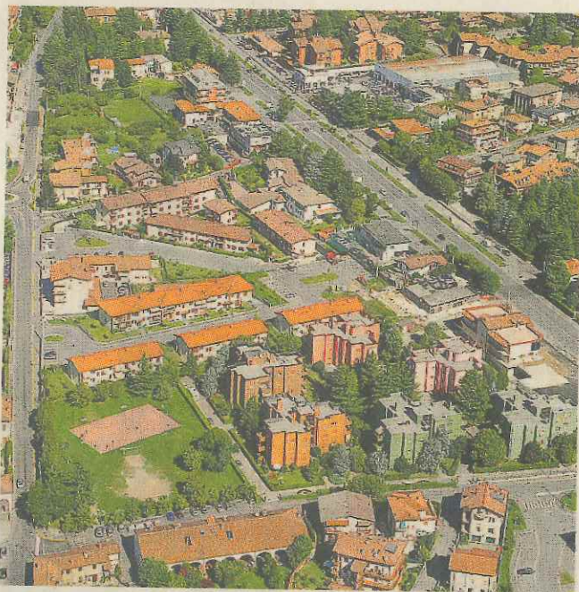
Dall'alto. La frazione Campagnola: qui le proteste per gli odori

a cui hanno aderito 76 persone. «Campagnola ambiente ha sospeso la raccolta delle firme giudicando le segnalazioni ricevute più che sufficienti per ritenere il problema meritevole di attenzione da