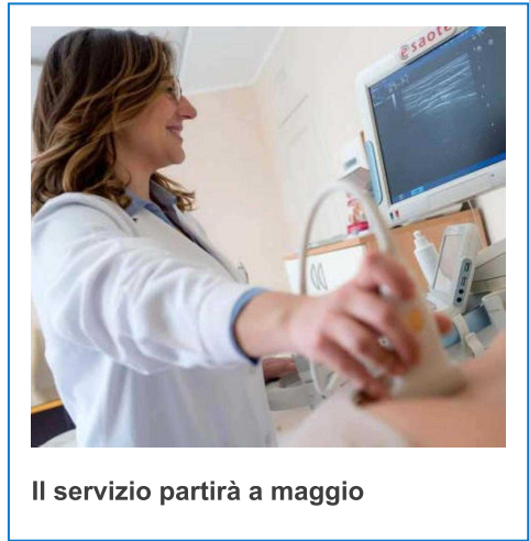
Il servizio partirà a maggio