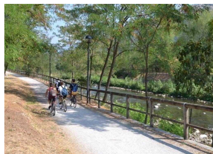
Il percorso ciclo-pedonale all'altezza di Concesio